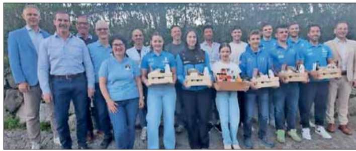
Gratulanten und erfolgreiche Rodler am Freitag in Völlan. Sportverein

SPORTVEREIN: Empfang für Rodler in Völlan