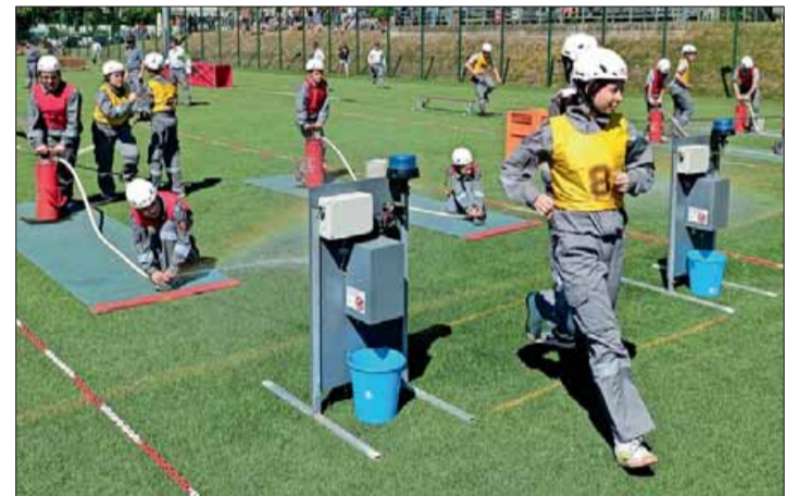
Buben und Mädchen im kameradschaftlichen Wettstreit.